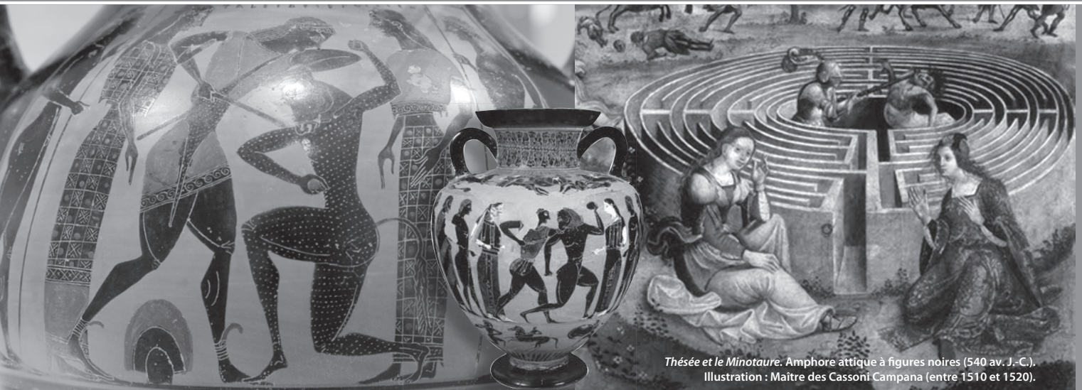
Thésée et le Minotaure. Amphore attique à figures noires (540 av. J.-C.). Illustration : Maître des Cassoni Campana (entre 1510 et 1520).