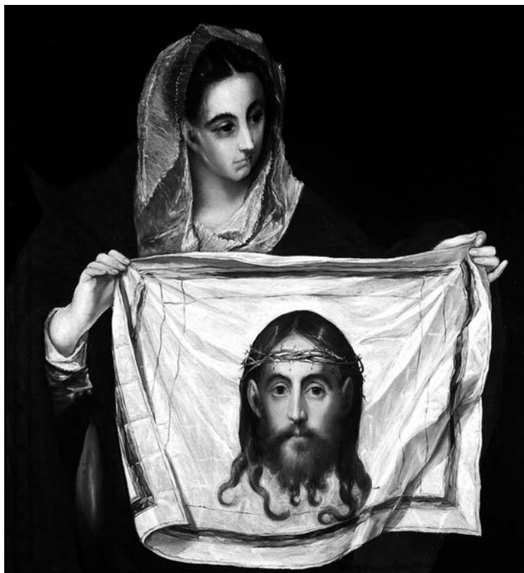
El Greco, Sainte Véronique avec le suaire , 1579 (Musée de Santa Cruz, Tolède).

« Véronique expliquait qu'après une série d'expériences de photographie directe sur papier, elle était passée à un support plus souple et plus riche, la toile de lin. Le tissu, rendu photosensible par une imprégnation de bromure d'argent, était exposé à la lumière. On y enveloppait ensuite le modèle, sortant tout trempé encore d'un bain de révélateur, des pieds à la tête, comme un cadavre dans un linceul, précisait Véronique. La toile était enfin traitée au fixateur et lavée. Des effets intéressants de mordancage pouvaient s'obtenir à condition de badigeonner le modèle au bioxyde de titane ou au nitrate d'urane. L'empreinte prenait alors des dégradés bleutés ou dorés. En somme, avait conclu Véronique, la photographie traditionnelle se trouve dépassée par ces créations nouvelles. » (Tournier, « Les suaires de Véronique », Le coq de bruyère , 1978, p. 170-171)