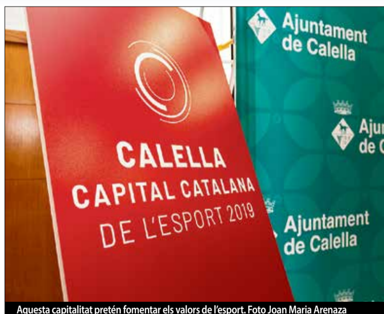
Aquesta capitalitat pretén fomentar els valors de l'esport.