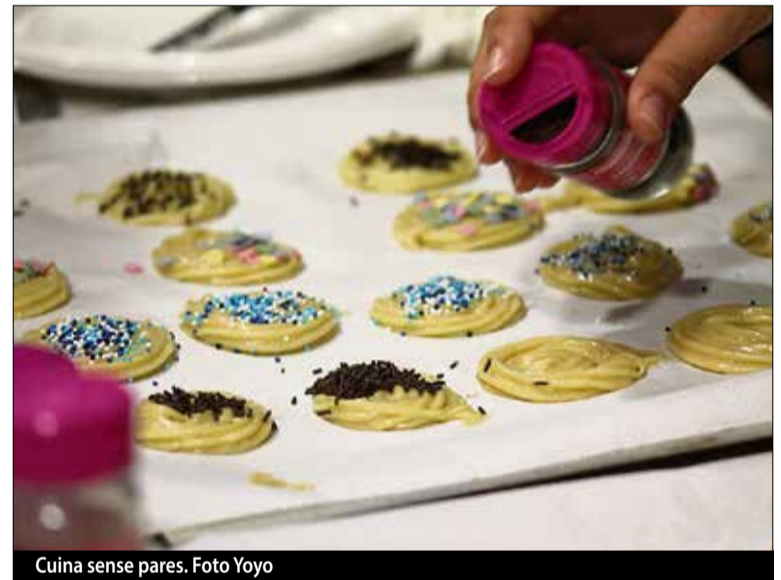
Cuina sense pares.

13 i 14/04. 'Olimpiades de salut'. A la Fira del Ram, estand del Casal de Joves, 18 h. ■