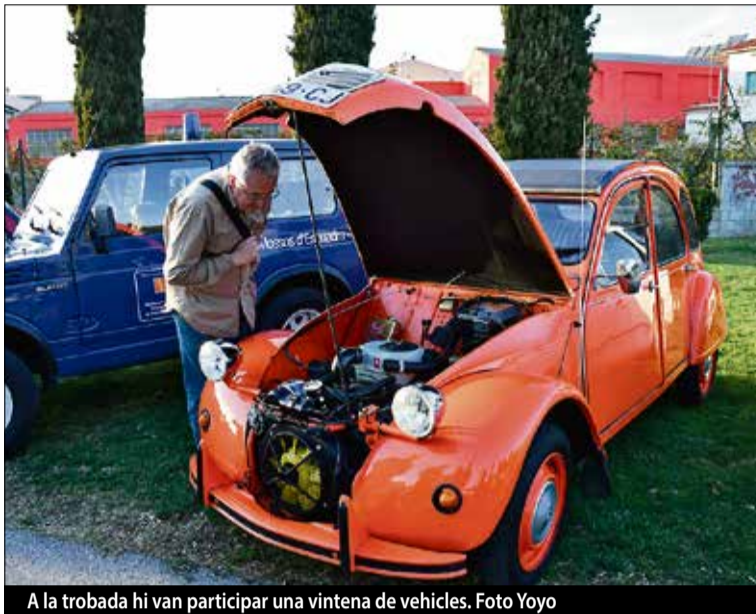
A la trobada hi van participar una vintena de vehicles.

La trobada va començar a la tarda, amb la concentració dels cotxes participants a la plaça de Poppi. Tot seguit, els vehicles van celebrar una cercavila pels carrers del centre de la població, acabant una altra vegada a la Plaça, on es va realitzar un concert musical. ■