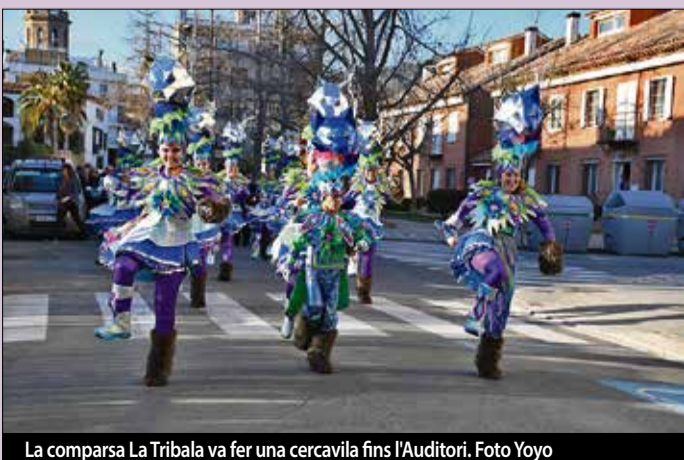
La comparsa La Tribala va fer una cercavila fins l'Auditori.

A la tarda, la comparsa La Tribala de Pineda de Mar va celebrar la Cercavila "Amb i per les dones" pels carrers de Pineda fins l'Auditori per reivindicar unes festes sense agressions masclistes, tant físiques com verbals. ■