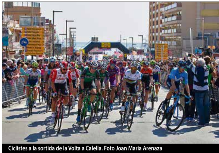
Ciclistes a la sortida de la Volta a Calella.