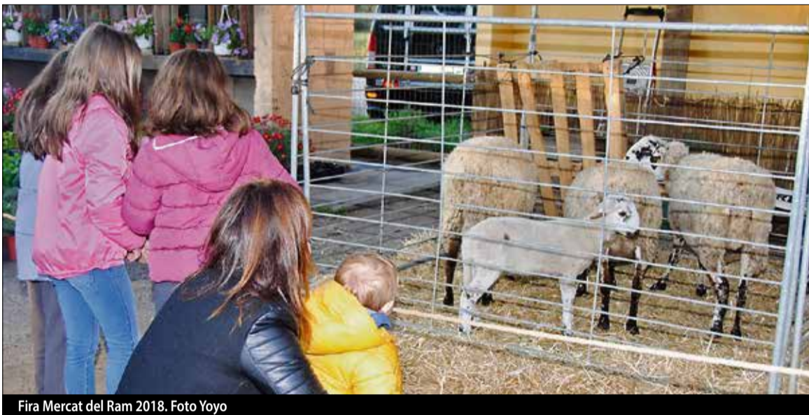
Fira Mercat del Ram 2018.

El foment de l'emprenedoria arribarà a través de l'impuls d'aquest sector amb eines que es posaran a l'abast properament i que tindran visibilitat a la Fira, com la guia per a noves activitats econòmiques a Tordera. La cultura popular i tradicional també tindrà especial rellevància a la Fira, que a través de les entitats locals i la Mostra d'Associacionisme Local es donarà major projecció als projectes i activitats que promouen les entitats locals en aquest sentit. ||