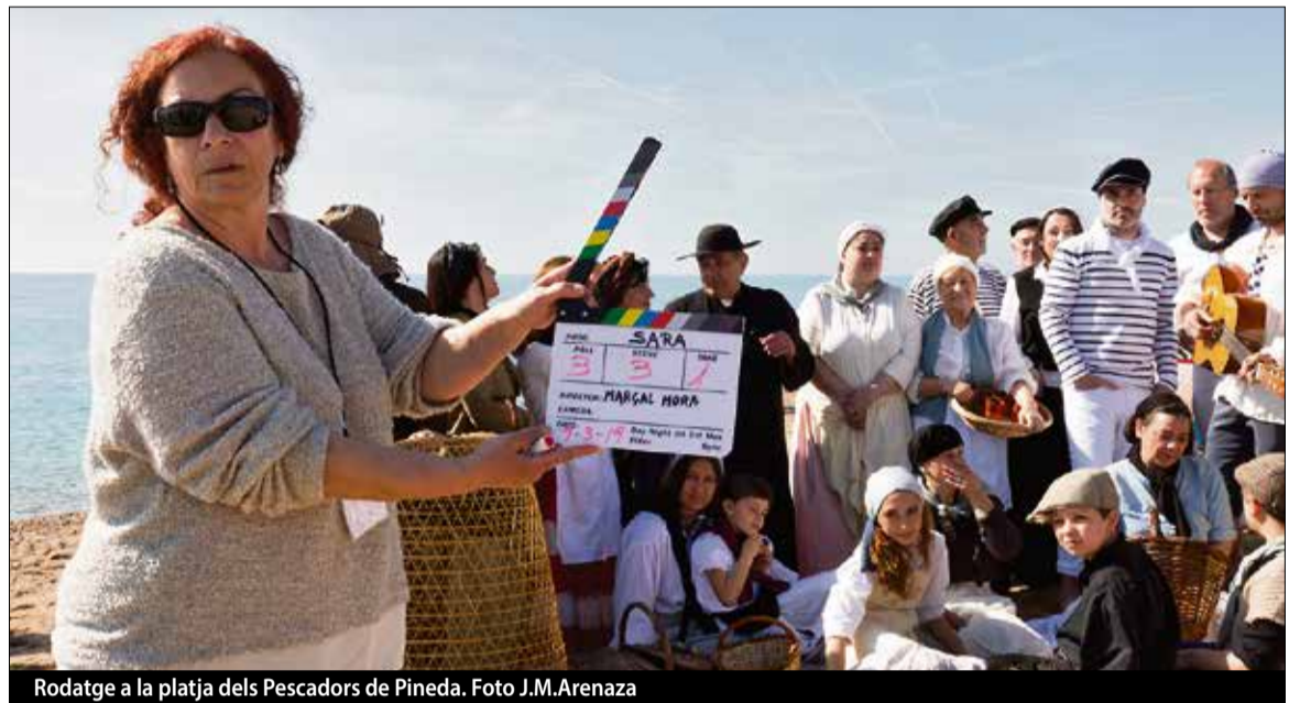
Rodatge a la platja dels Pescadors de Pineda.