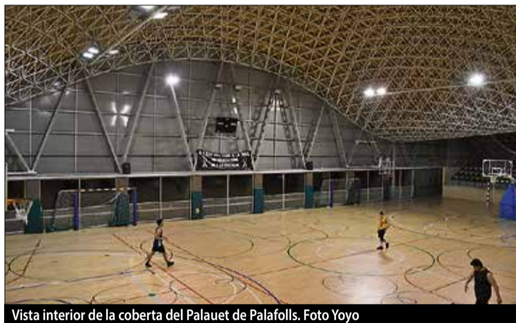
Vista interior de la coberta del Palaüet de Palafoxells.

El japonès Arata Isozaki, arquitecte del Palauet de Palafoxells i del Palau Sant Jordi de Barcelona, ha rebut el Premi Pritzker, el guardó més important de l'arquitectura, pel caràcter versàtil, influent i internacional de la seva obra. Pàg. 15