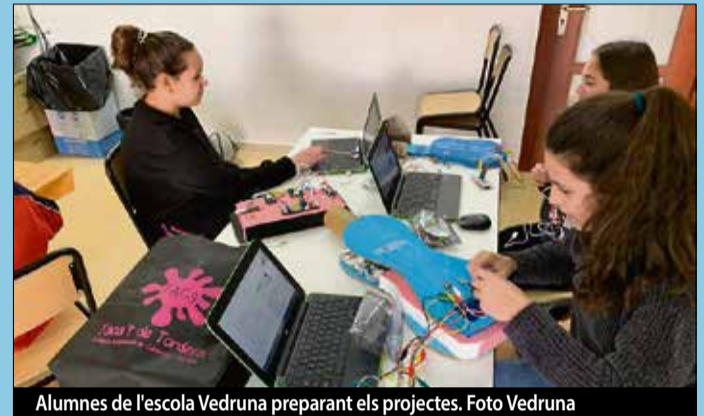
Alumnes de l'escola Vedruna preparant els projectes.

l'escola Vedruna van preparar un seguit d'instruments programats amb Scratch i muntats amb plaques Makey Makey, així com un projecte d'una casa domòtica i un taller de disseny i impressió 3D. ■