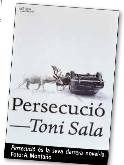
Persecució és la seva darrera novel·la.

Potser el més interessant per a mi ha estat el Premi Nacional, que me’l van concedir per Rodalies quan jo era relativament jove, amb 35 anys, i em va animar molt a continuar escrivint. És important que el reconeixement te’l donin quan ets jove i no quan estàs a punt de morir-te... Perquè llavors, per què el vols?