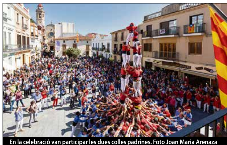
En la celebració van participar les dues colles padrines.

Ara, els Castellans de l'Alt Maresme esperen poder fer una gran temporada durant aquest 2019, repetint tots els èxits que van aconseguir durant la temporada 2018. La jornada de celebració del 5è aniversari també va comptar amb una cercavila, un concert i un dinar de germanor. ■