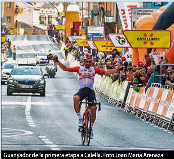
Guanyador de la primera etapa a Calella.