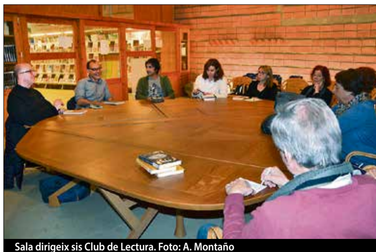
Sala dirigeix sis Club de Lectura.

M’agradaria fer una cosa més lluminosa, escriure un llibre d’humor. ■