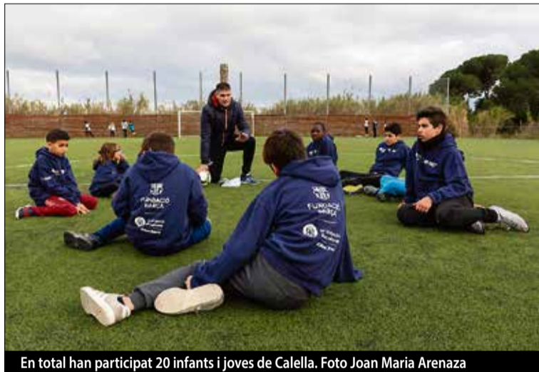
En total han participat 20 infants i joves de Calella.