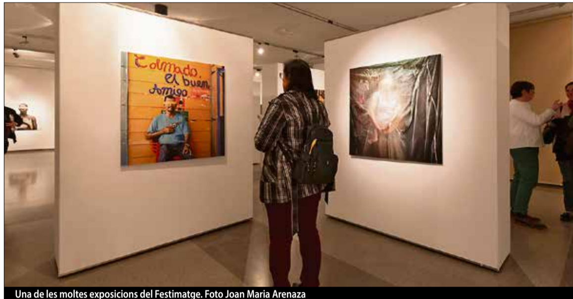
Una de les moltes exposicions del Festimatge.

Reuneix tres certàmens que, originàriament, se celebraven per separat: La Trobada Internacional de 9,5 mm, única a Espanya i de les poques que queden arreu del món, que aquest any celebra la