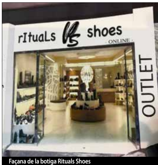
Façana de la botiga Rituals Shoes

En aquest establiment es podran comprar tant calçats de les millors marques com Nike, Mustang, Adidas, Asics i moltes més, des de 23,99 € i tot tipus de calçat de nens, dones i homes des de 5,95 €. També es poden fer compres online des del web www.ritualsshoes.com . Per a la inauguració han preparat moltes sorpreses. ■