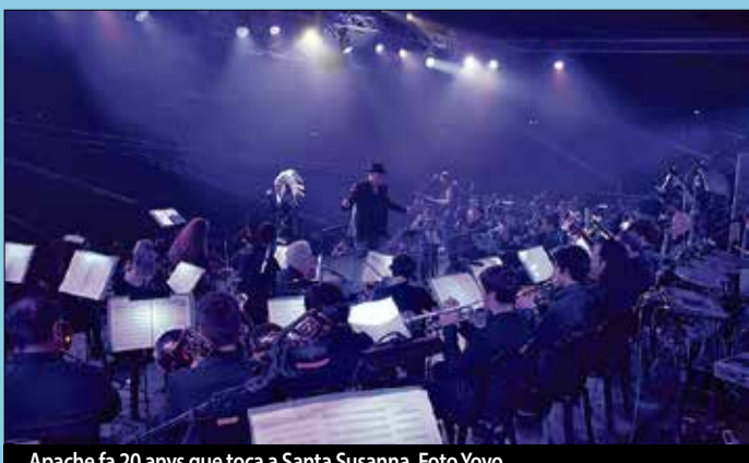
Apache fa 20 anys que toca a Santa Susanna.

ha estat acompanyat de l'Orquestra Simfònica de la Universitat de Barcelona, amb què van interpretar grans èxits musicals de bandes com Led Zeppelin, Toto o Pink Floyd. ||