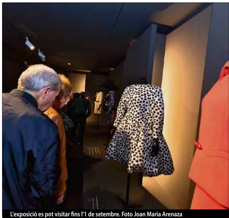
L'exposició es pot visitar fins l'1 de setembre.

diferents èpoques, des dels anys 50 i 60 fins als 90. El visitant també hi trobarà referències de la relació del geni amb Pineda i un espai audiovisual dedicat al dissenyador.