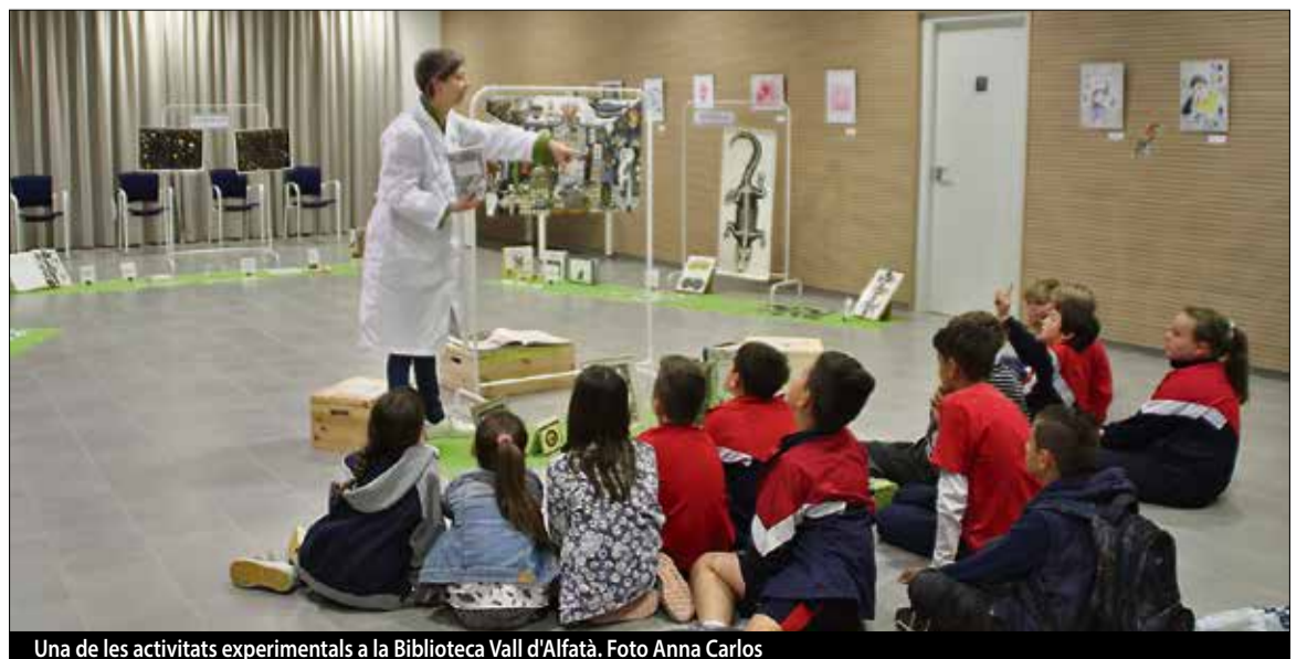
Una de les activitats experimentals a la Biblioteca Vall d'Alfatà.

La posada en funcionament d'aquest nou sistema va implicar canviar el procés d'etiquetatge del fons documental i bibliogràfic i l'activació de les etiquetes de radiofreqüència per posar en marxa el sistema automàtic. Una altra de les biblioteques que ja va néixer amb aquest nou sistema és la Vall d'Alfatà, de Santa Susanna, que ara al maig, celebrarà dos anys des de la seva obertura. ■