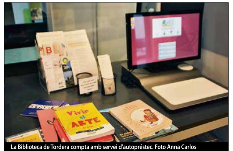
La Biblioteca de Tordera compta amb servei d'autoprèstec.

Un dels últims programes incorporats per les biblioteques, és el Bibliolab, un projecte de la Xarxa de biblioteques Municipals que té com a finalitat l'accés al coneixement a través de l'experimentació i metodologies innovadores i creatives, en un entorn col·laboratiu obert a la ciutadania.