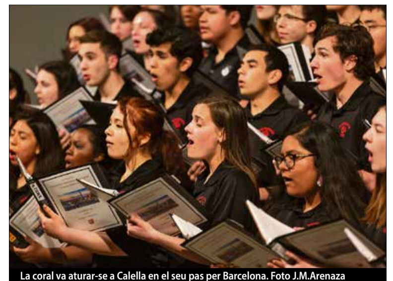
La coral va aturar-se a Calella en el seu pas per Barcelona.

Barrett Nash, manager del grup, ha explicat com han arribat a actuar a la ciutat calellena: 'Ens van convidar a cantar a aquesta preciosa església de Calella. El nostre cor ha cantat per tot Europa. El gener del 2017 vam actuar a la missa de Reis de la basílica de Sant Pere per al Papa Francesc, i algú relacionat amb la Sagrada Família ens va escoltar i ens va convidar. Estarem a Espanya durant