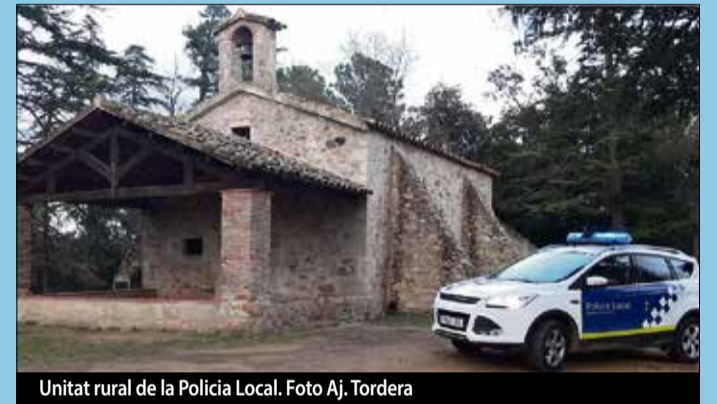
Unitat rural de la Policia Local.

ment del territori. A més a més, aquest augment suposarà poder cobrir necessitats i actuacions d'altres ubicacions en casos puntuals ampliant així la seguretat i la resposta que sigui més ràpida i eficaç. Cobriran més hores tenint en compte els bons resultats de la unitat rural ja existent. ■