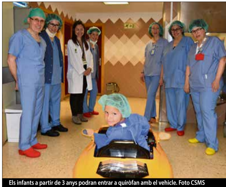
Els infants a partir de 3 anys podran entrar a quiròfan amb el vehicle.

«El vehicle ajuda els infants a entrar de manera més lúdica i menys traumàtica a quiròfan»