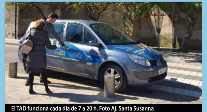
El TAD funciona cada dia de 7 a 20 h.

tots els veïnats del municipi. Per accedir al servei cal efectuar la reserva amb 24 hores d'antelació trucant al telèfon 900 69 65 66, de 8 a 20 h. El servei TAD està disponible de dilluns a diumenge de 7 a 20 h. ■