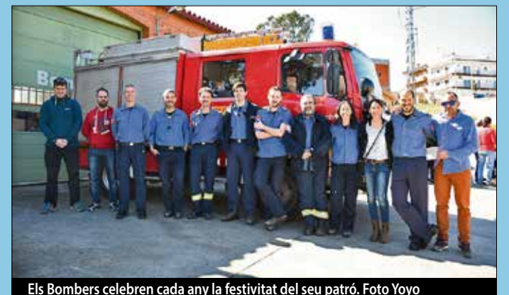
Els Bombers celebren cada any la festivitat del seu patró.

que pateix el Parc de Bombers. Dies després de la celebració, els bombers van realitzar una campanya de donació de sang, organitzada juntament amb el Banc de Sang i Teixits, on van aconseguir 71 donacions. ■