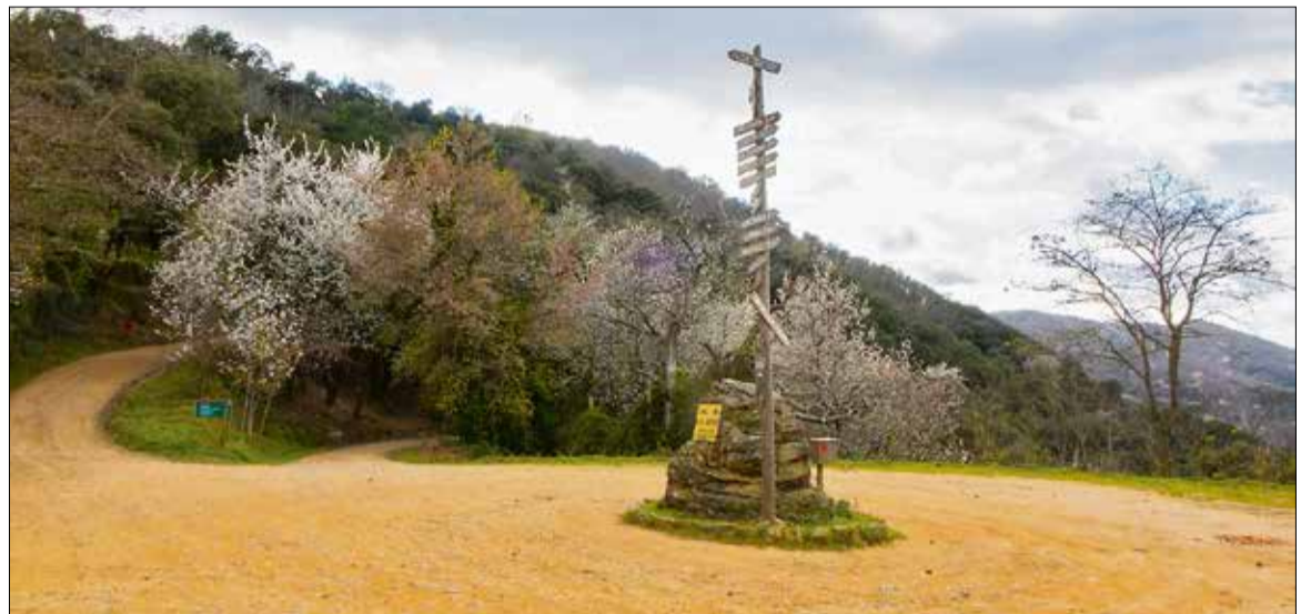
El Montnegre-Corredor és una de les quatre zones que contempla el projecte.