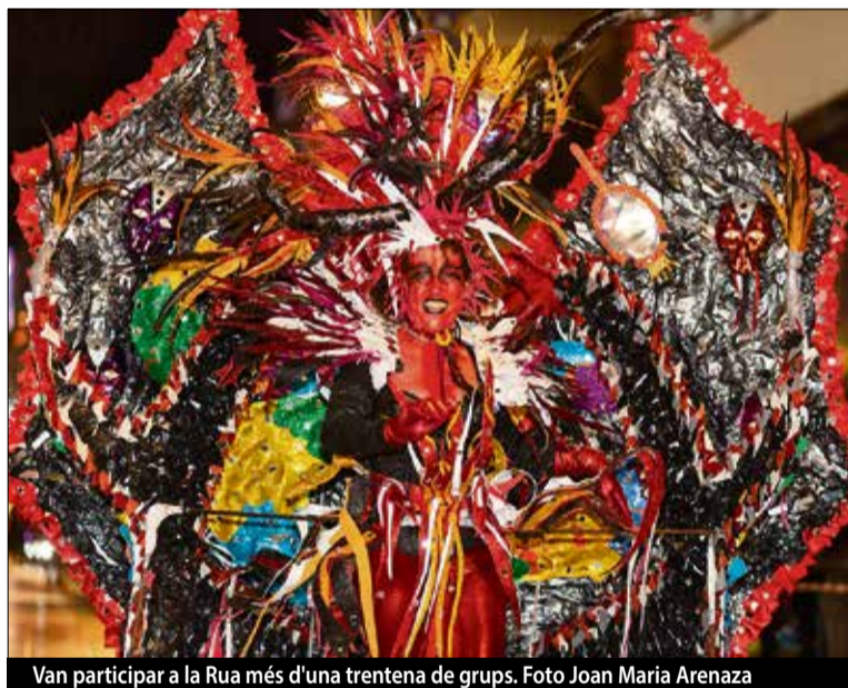
Van participar a la Rua més d'una trentena de grups.