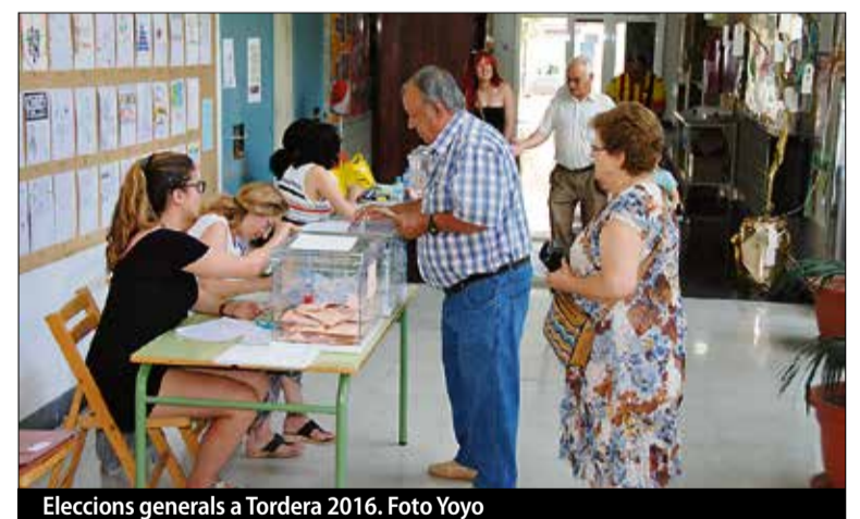
Eleccions generals a Tordera 2016.

RECORTES CERO-GV 1. Pascuala Gómez Iniesta ■