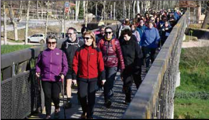
Els diners recaptats van anar al Centre Obert El Caliu de Tordera.

femení, l'objectiu de la marxa era recollir fons amb fins solidaris. Tots els diners recaptats van anar destinats íntegrament a la compra de tot el material necessari per al centre obert 'El Caliu' de Tordera. ■