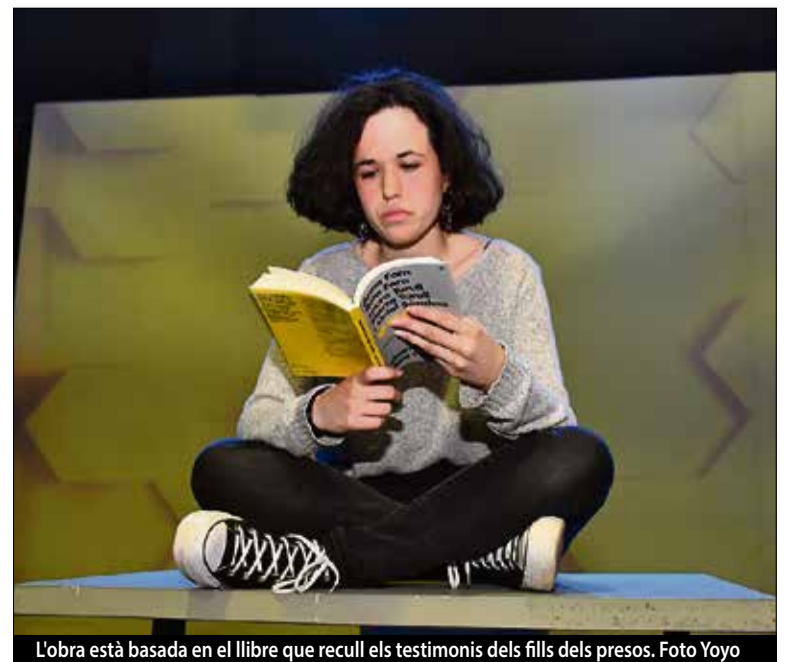
L'obra està basada en el llibre que recull els testimonis dels fills dels presos.

assolit en les funcions programades, Abans ningú deia t'estimo es tornarà a representar a Pineda la propera tardor i farà gira. ■