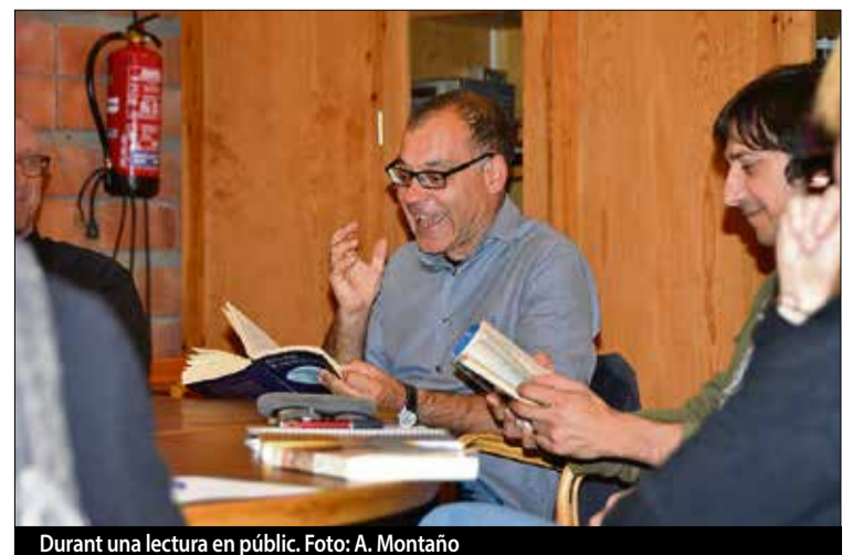
Durant una lectura en públic.