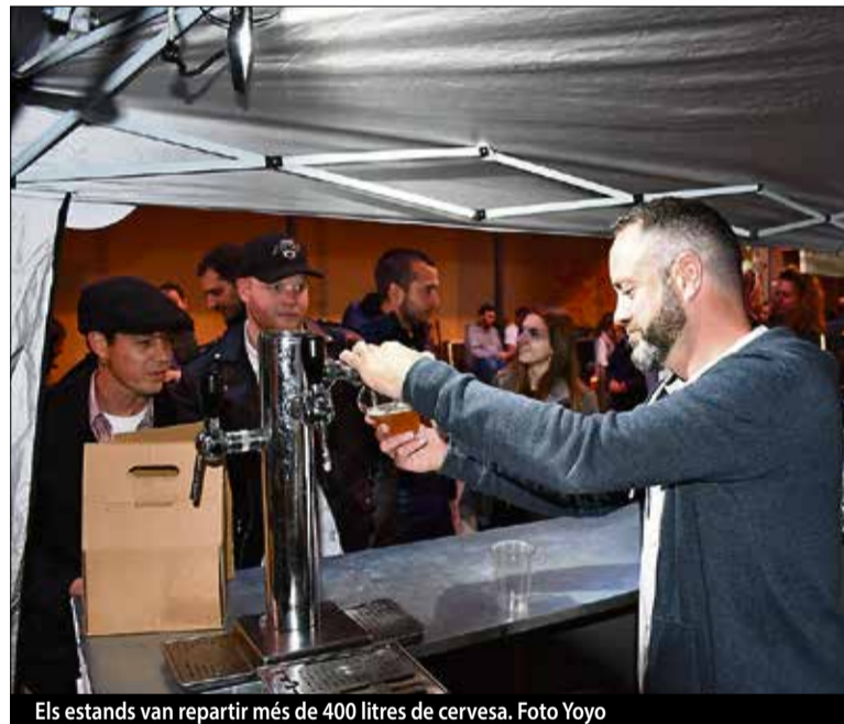
Els estands van repartir més de 400 litres de cervesa.