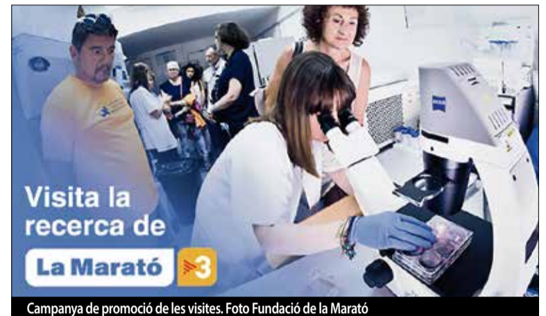
Campanya de promoció de les visites.

https://visitesrecercamarato.tv3.cat/site/MaratoTV3/