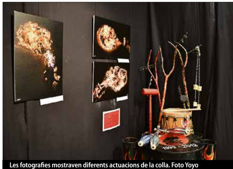
Les fotografies mostraven diferents actuacions de la colla.

Durant el 2018 els Diables de Tordera van celebrar els 25 anys com a colla. Entre els diferents actes que van organitzar per commemorar l'efemèride, l'entitat torderenca va ser l'encarregada d'encetar la Festa Major amb la lectura del pregó. Lluny de ser el tradicional, el pregó es va caracteritzar per l'animació dels mateixos diables i el foc, traslladant als oients com se sent un veritable diable. ■