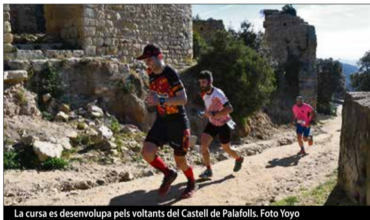
La cursa es desenvolupa pels voltants del Castell de Palafolls.

La sortida la van prendre 282 corredors i van ser 256 els que van poder arribar a la meta, situada al Palauet de Palafolls. ■