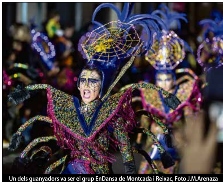
Un dels guanyadors va ser el grup EnDansa de Montcada i Reixac