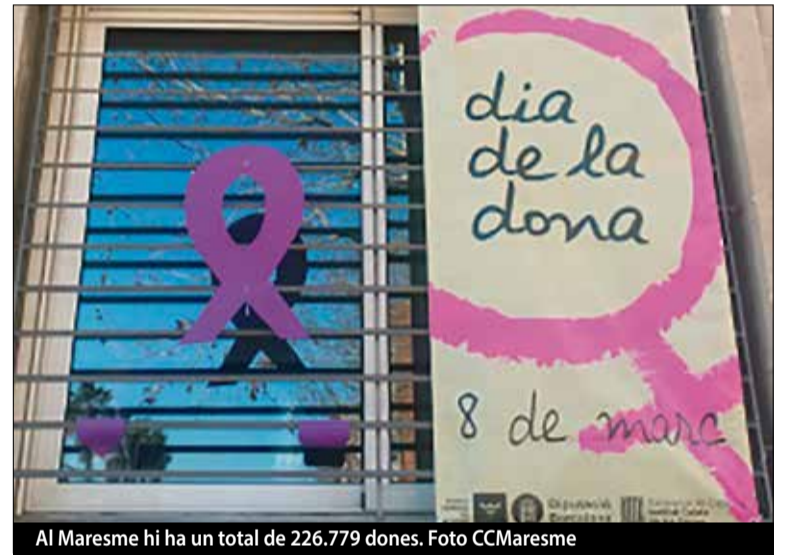
Al Maresme hi ha un total de 226.779 dones.

mateixa. El 66,61% dels llocs de treball que ocupen les dones de la comarca són a temps parcial i estan un 2,70% més pluriocupades que els homes. ■