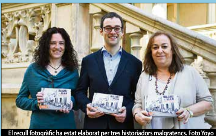
El recull fotogràfic ha estat elaborat per tres historiadors malgratencs.