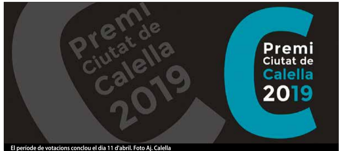
El període de votacions conclou el dia 11 d'abril.