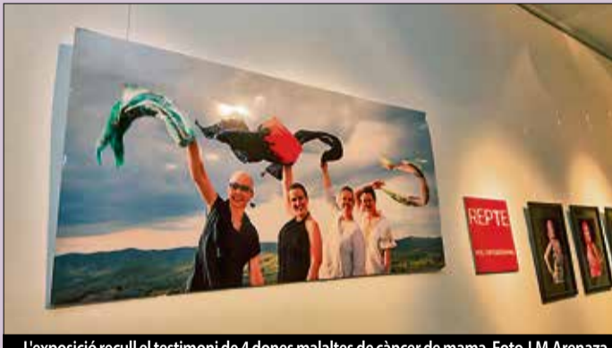
L'exposició recull el testimoni de 4 dones malaltes de càncer de mama.

laltia: el càncer de mama. Les fotografies, realitzades per Jordi Masbernat i Josep Salip, mostren tot el procés que van viure les quatre protagonistes. L'exposició itinerant també ha passat pel MiD de Palafròlles. ■