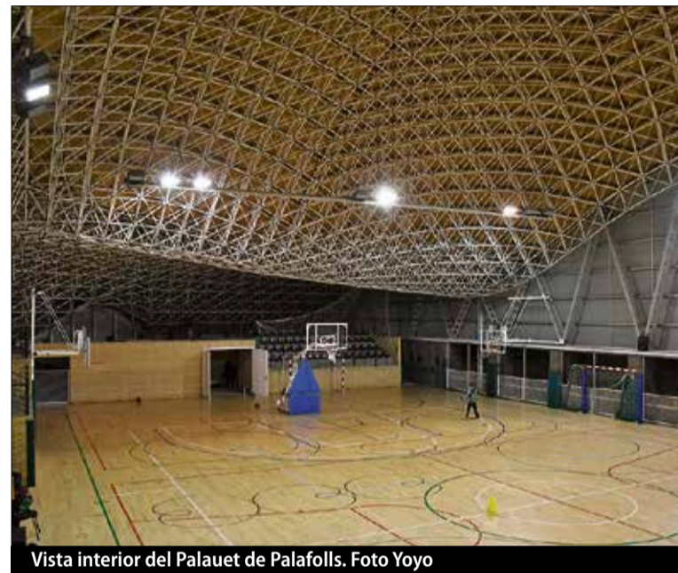
Vista interior del Palauet de Palafolls.

El jurat que ha atorgat aquest reconeixement ha destacat de l'arquitecte i la seva obra el seu caràcter "versàtil, influent i veritablement internacional" i el fet que Isozaki representa un pont entre la cultura oriental i la occidental, amb més d'un centenar de obres construïdes. ■