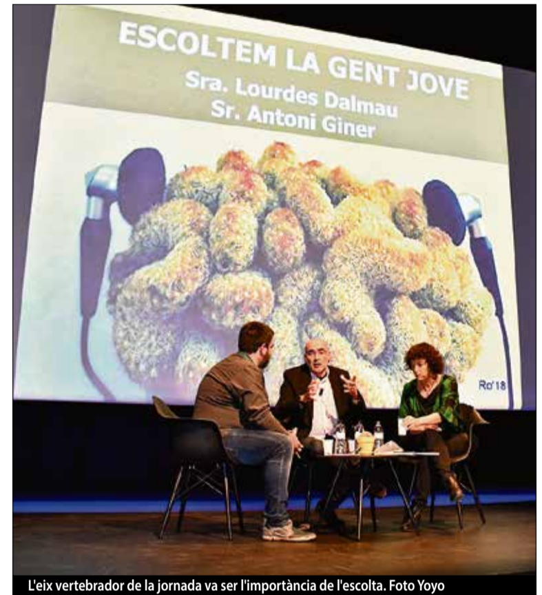
L'eix vertebrador de la jornada va ser l'importància de l'escolta.

«Es tracta d'un esdeveniment de referència al territori en l'àmbit de la salut»