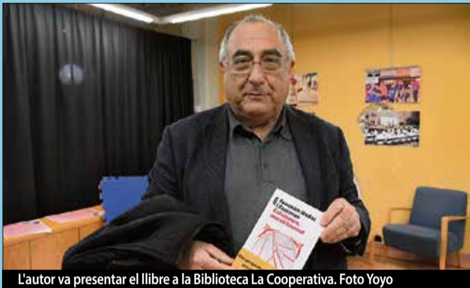
L'autor va presentar el llibre a la Biblioteca La Cooperativa.

tòpics, continua amb l'anàlisi de l'explosió sobiranista i el xoc amb l'Estat i es compromet, amb 12 propostes concretes. Amb aquesta obra, Nadal, ha volgut trencar el silenci sobre el laberint polític que viu Catalunya. ■