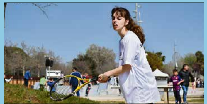
La jornada va comptar amb la participació dels clubs esportius de Malgrat.

pacitat- d'hoquei, bàsquet, futbol, etc. La jornada va comptar amb la participació dels clubs esportius malgratencs i es va aprofitar per celebrar una campanya de donació de sang organitzada pels bombers voluntaris de Malgrat. ■