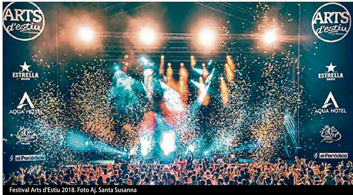
Festival Arts d'Estiu 2018.