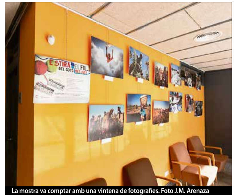
La mostra va comptar amb una vintena de fotografies.

El comerç just és un sistema comercial solidari i alternatiu al convencional que persegueix el desenvolupament dels pobles i la lluita contra la pobresa. Es basa en condicions laborals i salaris