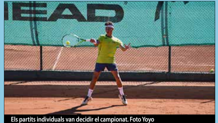
Els partits individuals van decidir el campionat.

cop a casa. L'eliminatòria va tenir partits molt igualats i amb un nivell altíssim de tennis. Tot i això, els favorits, el RCT Barcelona, es va imposar per 4 a 1. Des del club es valora molt positivament haver arribat a la final i el suport rebut. ■