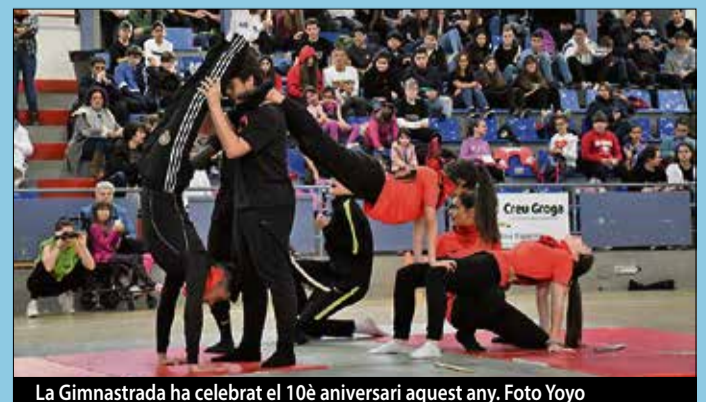
La Gimnastrada ha celebrat el 10è aniversari aquest any.

any la Gimnastrada ha celebrat el 10è aniversari. 10 anys durant els quals ha passat a ser una activitat amb participació comarcal, ja que també hi prenen part centres educatius i entitats d'altres poblacions com Canovelles, Sant Pol de Mar o Palafolls. ■