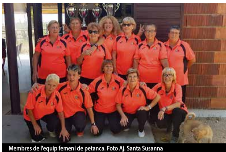
Membres de l'equip femení de petanca.