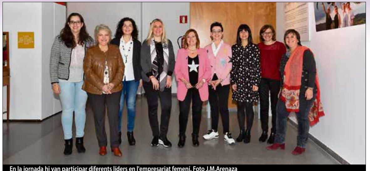
En la jornada hi van participar diferents líders en l'empresariat femení.