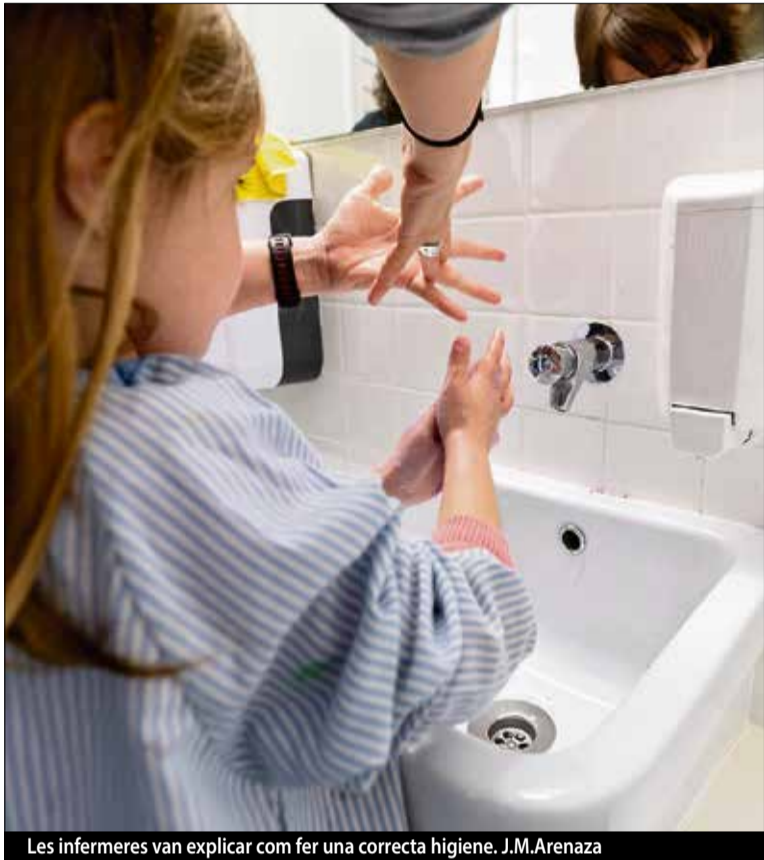
Les infermeres van explicar com fer una correcta higiene. J.M.Arenaza

«Es tracta d'una prova pilot amb l'objectiu d'inculcar als petits una bona higiene de mans»