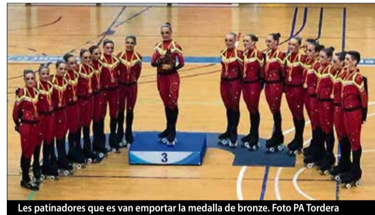
Les patinadores que es van emportar la medalla de bronze.

La medalla de plata ha estat pel Club Patinatge Bescanó, que repeteix la posició aconseguida en edicions anteriors gràcies a al número "Noche de ilusión". La tercera posició va ser per al PA Tor-