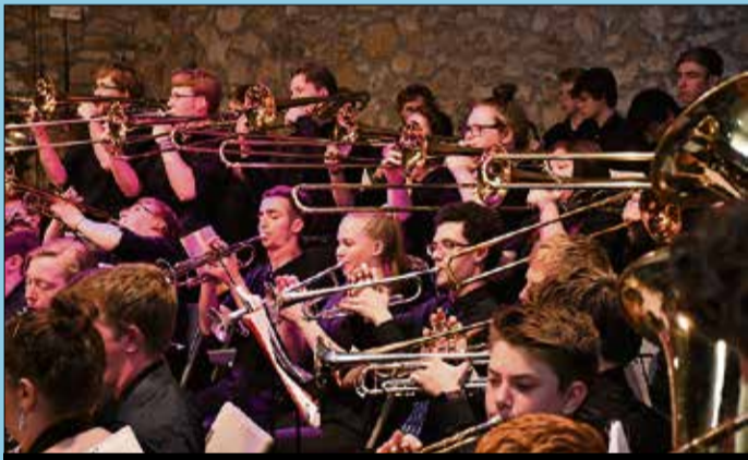
Les dues bandes van interpretar conjuntament alguns temes.

Units a Catalunya. El concert va començar a càrrec de la Banda Palafolls que van tocar tres peces, i després d'una peça conjunta entre les dues formacions, la banda de Minnesota va tocar un total de 13 composicions. ||