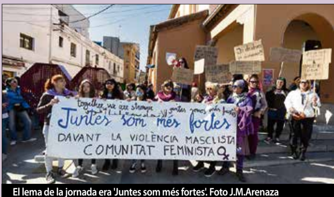
El lema de la jornada era 'Juntes som més fortes'.

aprofitar per celebrar la 7a Marxa per la Dona Treballadora, al passeig Manuel Puigvert on es van concentrar més d'un centenar de persones. La marxa, va ser convocada per l'Associació per la Promoció de la Dona Treballadora juntament amb Calella Marxa i Oncolliga. ■