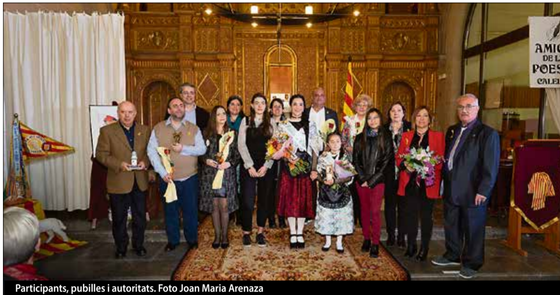
Participants, pubilles i autoritats.