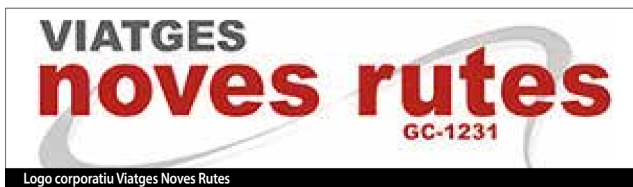
Logo corporatiu Viatges Noves Rutes

Els podeu trobar a Santa Coloma de Farners al carrer Sant Dalmau 17 bis. I a www.novesrutes.com . Tel: 972 877 485 ■