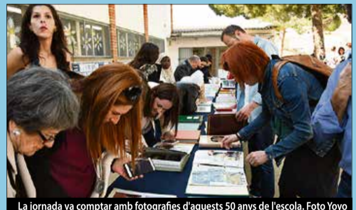
La jornada va comptar amb fotografies d'aquests 50 anys de l'escola.

sobre l'evolució de l'escola. El centre va néixer ara fa 50 anys a partir d'unes necessitats educatives que hi havia al barri, abans de l'any 69, fins que al final es va construir l'escola. ■