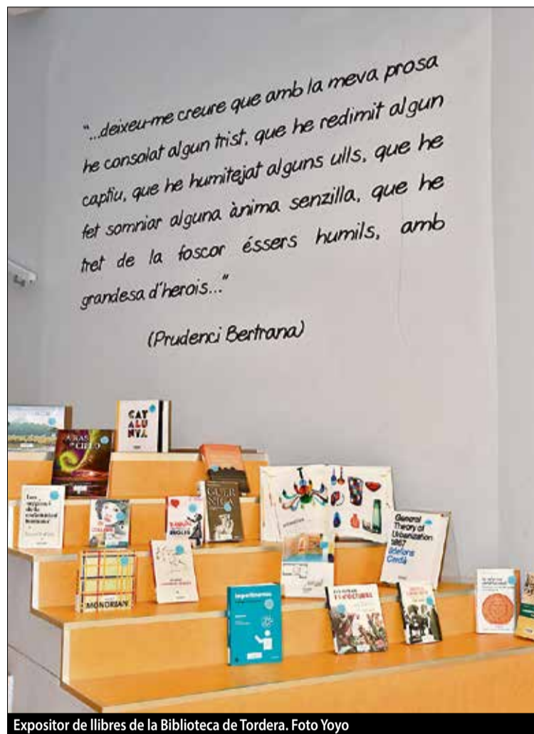
Expositor de llibres de la Biblioteca de Tordera.

El 23 d'abril se celebra, com cada any, el dia del llibre i la rosa, i, aquest any, cau just després de Setmana Santa. Aprofitant la proximitat de la celebració, hem entrevistat les directores i director d'algunes biblioteques de l'Alt Maresme per què ens expliquin com funcionen, quines activitats realitzen i també per què ens recomanin autors de la zona i les últimes novetats literàries. Més informació a les pàgines 3 i 4.