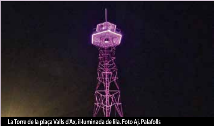
La Torre de la plaça Valls d'Ax, il·luminada de lila.

El Casal de la Dona també va voler commemorar l'efemèride, obrint les seves portes a tots els públics per mostrar les seves activitats a tots aquells que hi estiguessin interessats. ■