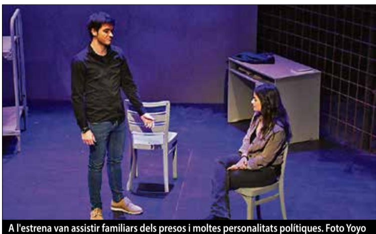
A l'estrena van assistir familiars dels presos i moltes personalitats polítiques.

El Centre Cultural i Recreatiu de Pineda de Mar ha viscut una estrena històrica. La companyia del centre ha realitzat una adaptació teatral del llibre Abans ningú deia t'estimo , basat en el relat dels testimonis dels fills i filles dels presos polítics. Es van fer 4 representacions. Pàg. 6