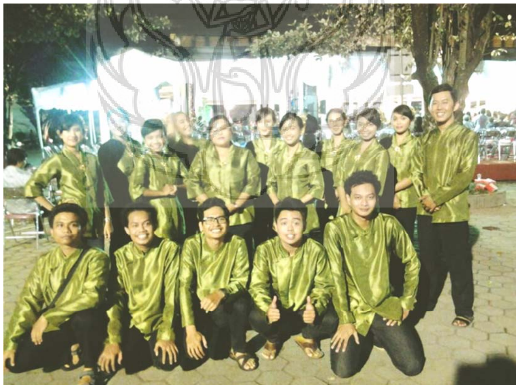
Foto 4. Anggota Komunitas Mardala Mahadibya GKJ Bantul setelah mengisi ibadah perayaan natal di kantor Keptintahan DIY tahun 2013