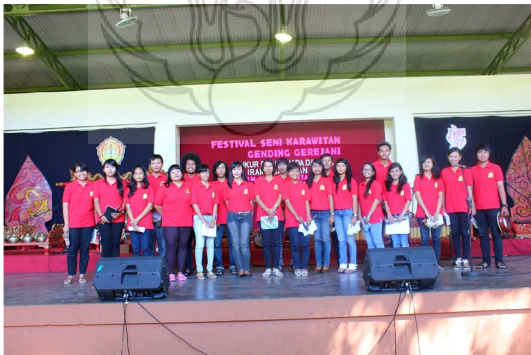
Foto 2. Anggota Komunitas Mardala Mahadibya GKJ Bantul sewaktu menjadi peserta Festival Seni Karawitan Gending Gerejawi di Universitas Sanata Dharma tahun 2012