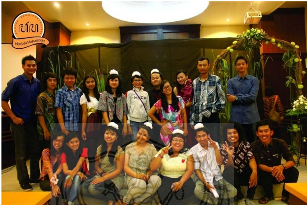
Foto 1. Anggota Komunitas Mardala Mahadibya GKJ Bantul setelah mengiringi ibadah malam natal 24 Desember 2012