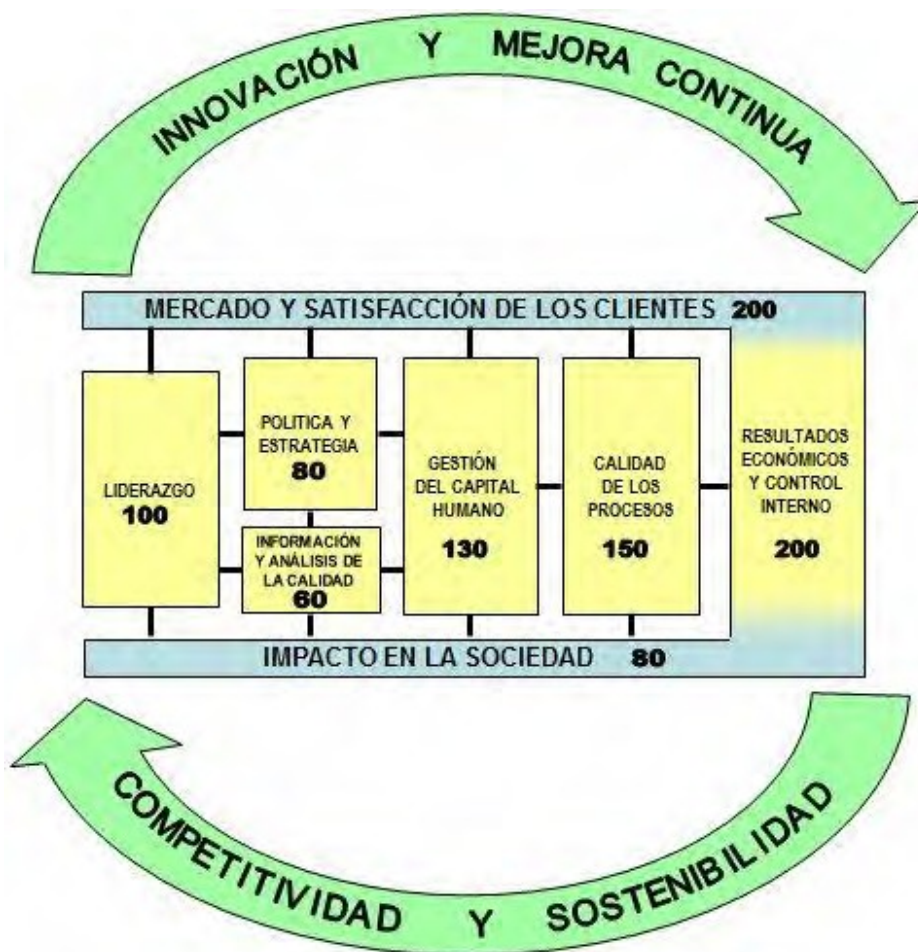
Fig. 1. Modelo de Excelencia del Premio Nacional de Calidad de la República de Cuba

Los criterios que conforman dicho Modelo: