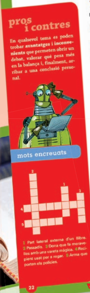
Amb reportatges actuals a l'inici de cada bloc.