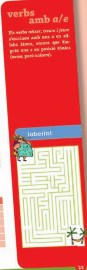
Amb informació als marges per a repassar els conceptes.