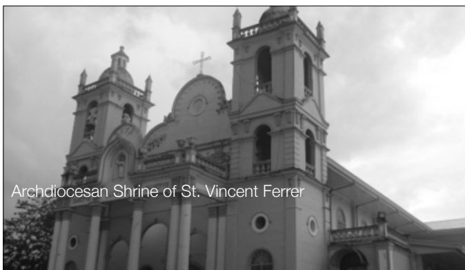
Archdiocesan Shrine of St. Vincent Ferrer