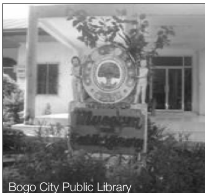
Bogo City Public Library

(Tingnan kung kaya ng mag-aaral na tukuyin kung ano ito at kung nasaan sila)