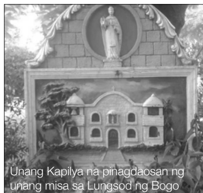
Unang Kapilya na pinagdaosan ng unang misa sa Lungsod ng Bogó