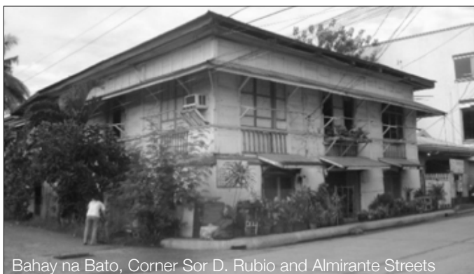
Bahay na Bato, Corner Sor D. Rubio and Almirante Streets