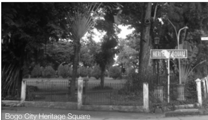
Bogo City Heritage Square