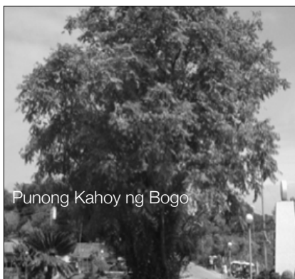
Punong Kahoy ng Bogó