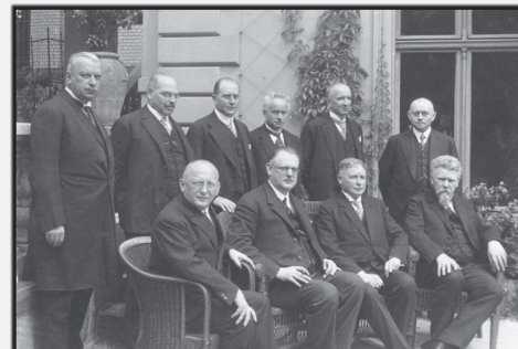
Kabinetts der Weimarer Republik im Juni 1928

In den nächsten Arbeitsblättern beschäftigen wir uns mit der deutschen Geschichte in der Zeit von 1918 bis 1933 – der Zeit der Weimarer Republik. Zunächst erfahren wir wichtige Dinge über den äußerst schwierigen Beginn des ersten Demokratieversuchs in Deutschland. Dabei wird schnell deutlich werden, dass der Übergang vom Kaiserreich hin zu einer Demokratie ein schwerer Weg war. Zwar bekamen die Führer der demokratischen Parteien die ganze Macht im Staate, aber gleichzeitig mussten sie die Verantwortung für den verlorenen Krieg übernehmen. Das Militär, das bis in die letzten Kriegswochen nur von Erfolgen berichten ließ, schob den neuen Machthabern die Schuld für die Niederlage am 1. Weltkrieg zu. Dies stellte eine enorme Belastung für den Aufbau der Demokratie dar. Hinzu kam ein Friedensvertrag, der der deutschen Bevölkerung aufgezwungen wurde und ihr die alleinige Schuld für den Krieg zusprach. Politische Gruppierungen von links und rechts versuchten die junge Demokratie zu stürzen und ihre eigenen politischen Vorstellungen durchzusetzen.