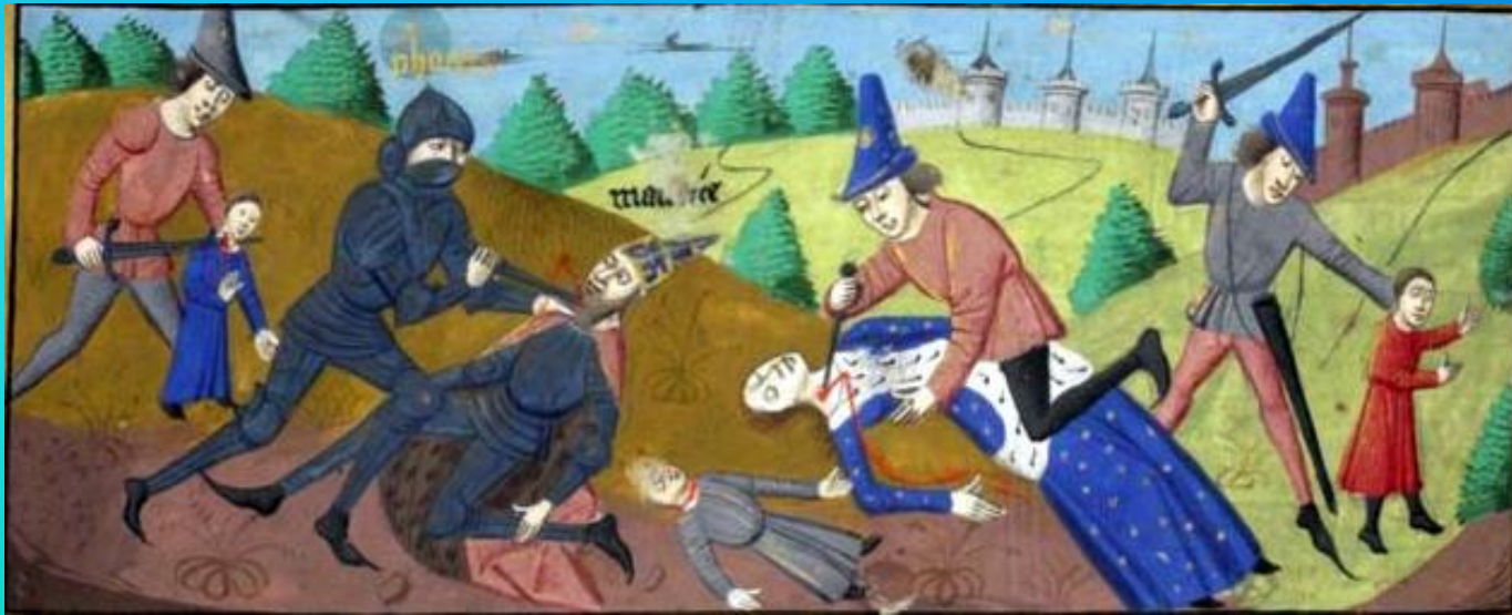
Rappresentazione grafica di una scena del Filocolo, romanzo con tema medievale