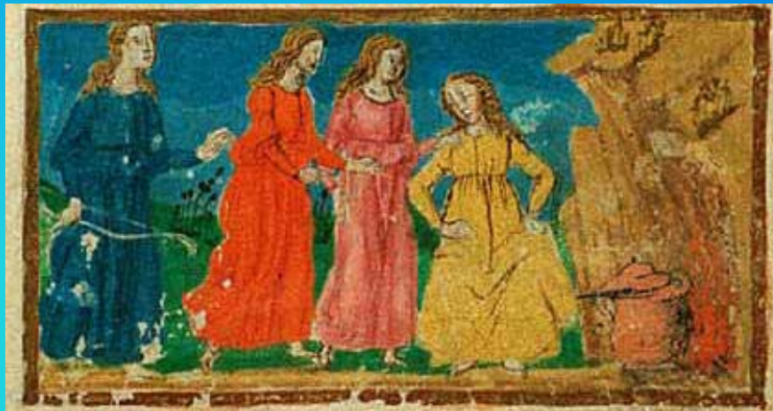
Quadro antico rappresentante l'opera Ninfale Fiesolano