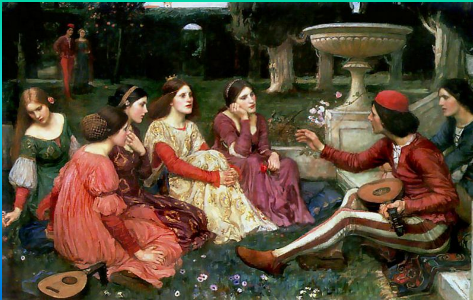
Quadro raffigurante una scena del Decamerone.... di John William Waterhouse