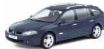
Nya Renault Laguna till Sverige.