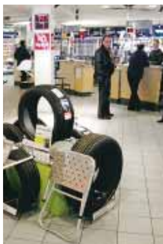
Ett varuhus för Volvo- och Renaultägare.

– Anledningen är enkel. Volvokortet har väldigt förmånliga villkor som är speciellt utformade för dem som kör Volvo eller Renault.