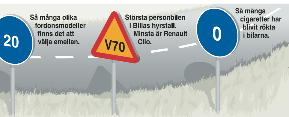
ILL: SVENSKA GRAFIKBYRÅN

Karosserityper blandas och helt nya bilmodeller skapas. Bilföretagen försöker hitta nischer för de alltmer specialiserade biltyperna.