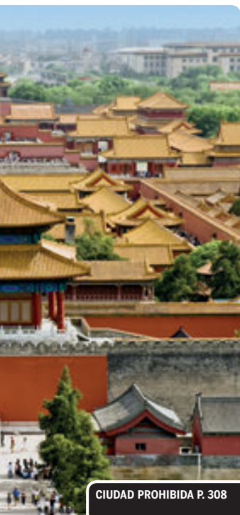
CIUDAD PROHIBIDA P. 308