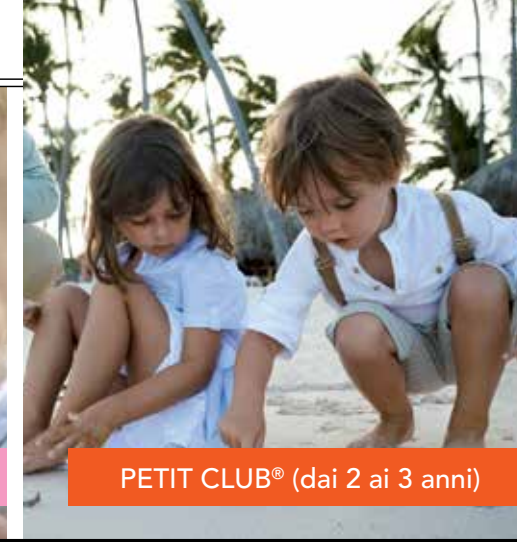
PETIT CLUB® (dai 2 ai 3 anni)