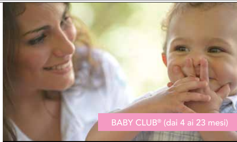
BABY CLUB® (dai 4 ai 23 mesi)

Poiché armonia significa dare a tutti il proprio spazio, potrete affidarci i vostri piccoli durante il vostro soggiorno quando e quanto vorrete. Club Med ha previsto strutture specifiche per tutte le età: marchio di fiducia e di tranquillità, i nostri G.O® qualificati assisteranno i vostri bambini in totale sicurezza.