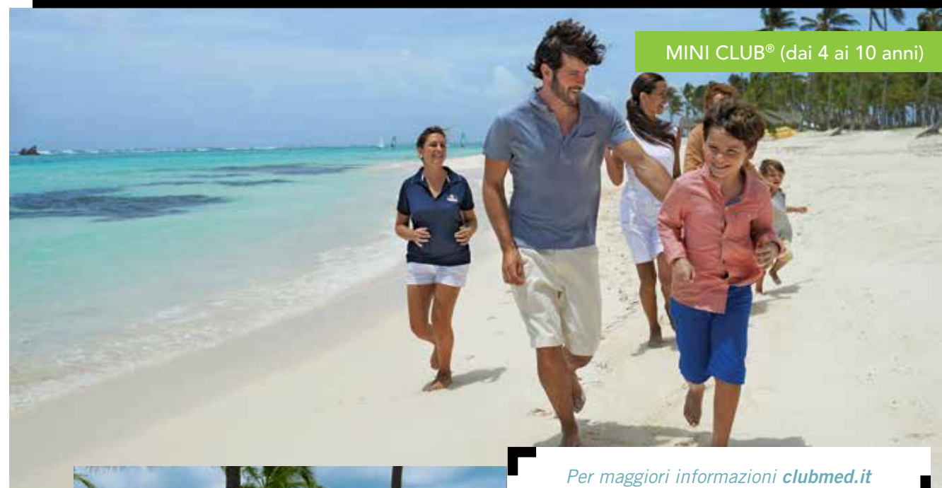
MINI CLUB® (dai 4 ai 10 anni)