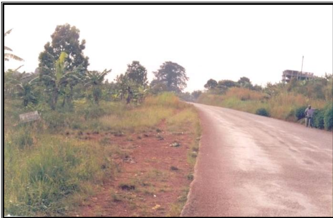
Ici nous voyons un membre à l'entrée du site du projet et indiquant le lieu.