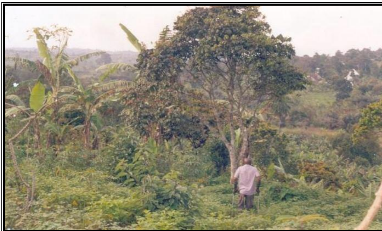
Ici nous sommes sur le site proprement dit où la ferme pilote doit être construite. Le membre nous guide dans cette verdure qui est une zone. Car n'étant pas loin de la route (15m environ) pour évacuer les produits.