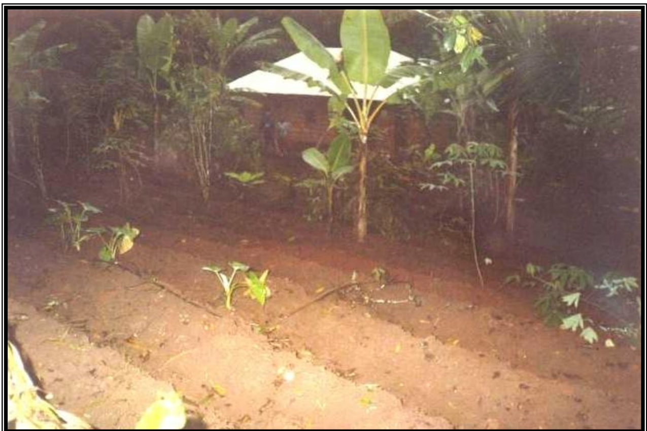
Ici nous voyons le logement qui sera destiné aux handicapées et quelques partenaires qui vont travailler dans le projet dans le cadre de sa réalisation