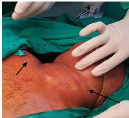
Fig. 1. Edema del cuello y la región anterosuperior derecha del tórax