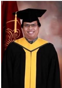
PEMBANTU DEKAN I