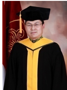
PEMBANTU DEKAN II