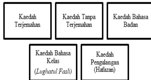
Rajah 3: Strategi PdP Berpusatkan Guru

Kaedah ini ialah kaedah tradisional melalui pengulangan kosa kata yang dipelajari oleh murid. Pengajaran bahasa Arab secara tradisional seperti pembelajaran mahfuzat adalah melalui pengulangan hafalan. Hafalan kosa kata perlu dikuasai terlebih dahulu bagi memastikan pembelajaran secara mastery berlaku (Mohd Rosdi dan Mat Taib, 2006). Secara keseluruhan strategi PdP berpusatkan guru adalah seperti dalam rajah 3: