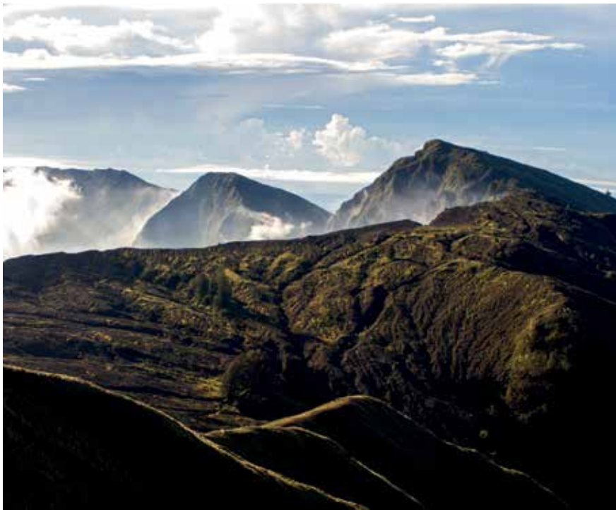
Guratan-guratan lanskap Gunung Tambora terlihat dari Puncak Tambora (atas). Menggunakan kapal motor untuk menuju Pulau Satonda dari Labuan Barat (kanan).

S ekitar 200 tahun silam, 10 April 1815, Gunung Tambora melampaikan “amarah” yang sudah dipendamnya. Namun, kini Tambora melahirkan peradaban baru: flora dan fauna, kehidupan masyarakat yang meramu nasib dari mengolah sumber daya alam, dan panorama indah.