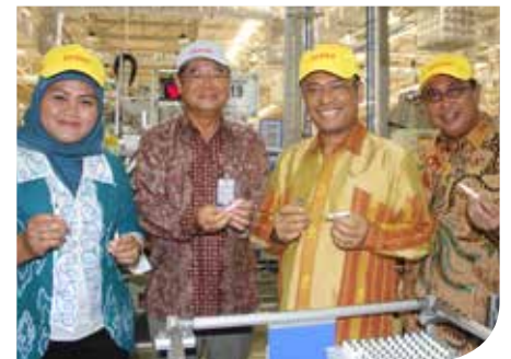
Mampir sebentar di area pembuatan busi, saat touring dalam pabrik.

Pabrik ketiga Denso saat ini memiliki 788 karyawan, yang akan bertambah hingga menjadi 1.100 orang. Bagi Denso, sumber daya manusia (SDM) adalah poin penting