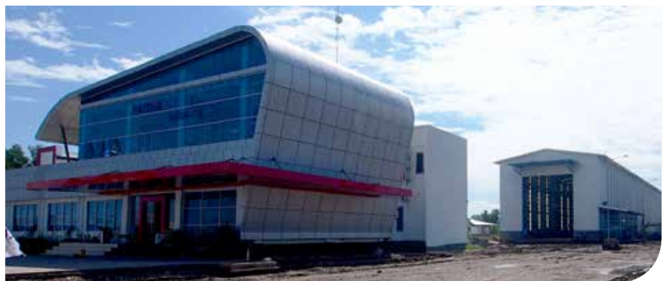
Bangunan workshop tahap pembangunan pertama

Tahap pembangunan pertama seluas 8 ha, terdiri dari workshop seluas 2000 m 2 , area office , sarana penunjang seperti water treatment plant dan klinik, serta area docking yang terdiri dari dua line barge dan dua line tugboat yang menggunakan sistem slipway .