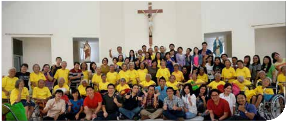
Foto kegiatan bakti sosial di Panti Werdha "Melania"

Paskah bukan hanya perayaan untuk memperingati kebangkitan-Nya, Yesus dengan rela menderita di salib untuk menebus dosa umat manusia, selayaknya kita juga bersyukur dengan tindakan nyata peduli kepada sesama, " Jangan Berhenti di Kamu "