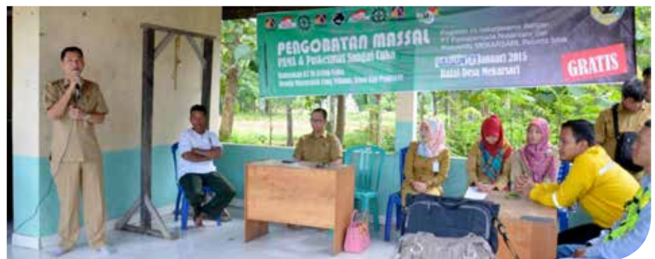
Suasana pengobatan gratis kepada masyarakat desa Mekarsari

Bekerjasama dengan Puskesmas Sungai Cuka, pada 14 Januari lalu, CSR dan SHE PAMA ARIA melaksanakan kegiatan pengobatan massal sekaligus sosialisasikan budaya K3 kepada masyarakat Desa Mekarsari. Sasaran kegiatan ini adalah warga yang kurang mampu dengan jumlah 110 peserta.