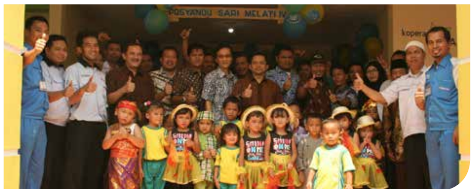
Foto bersama Para Pengurus Koperasi Astra, Lurah Desa Wanasari dan Perwakilan Kopnit Affco dengan anak PAUD RW 021

Dengan demikian, diharapkan keberadaan Koperasi Astra dapat secara langsung dirasakan oleh anggota, keluarga dan masyarakat sekitarnya.