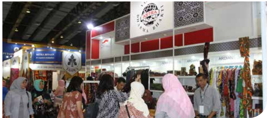
Pengunjung melihat produk yang dipamerkan oleh UMKM mitra Yayasan Dharma Bhakti Astra (YDBA) dalam Pameran Inacraft 2015 di Jakarta Convention Center yang berlangsung pada tanggal 8-12 April 2015

Pameran bertema From Small Village to Global Market ini merupakan salah satu pameran kerajinan terbesar di Indonesia. “Saya yakin, kerajinan Indonesia mampu bersaing dengan negara lain dan suatu saat akan menjadi yang terbaik,” ujar Presiden Republik Indonesia Joko Widodo saat membuka pameran pada 8 April. Ada enam UMKM mitra YDBA yang ikut berpameran. Mereka berasal dari Bogor, Bandung, Palembang, Yogyakarta dan Mataram. Mereka adalah Azka Syahrani yang memproduksi berbagai macam