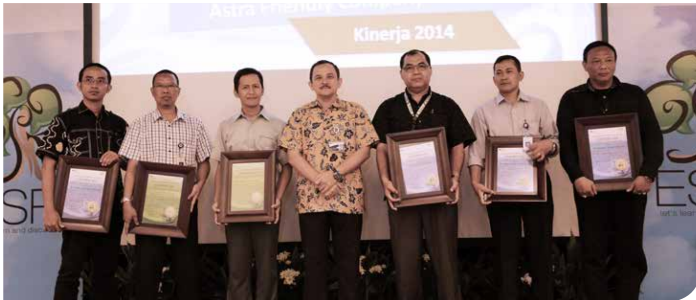
Pemberian piagam penghargaan kepada para pemenang AGC & AFC kinerja 2014

Melalui forum ini diharapkan rekan-rekan pelaku ESR dapat mengambil nilai-nilai penting dari materi-materi yang disajikan oleh narasumber dan dapat diterapkan pada setiap perusahaan