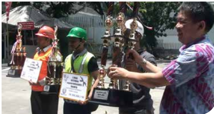
Para pemenang Skill Contest Fire Fighting

Juara III: PT Fuji Technica Indonesia (Rp 300.000 rupiah dan piala)