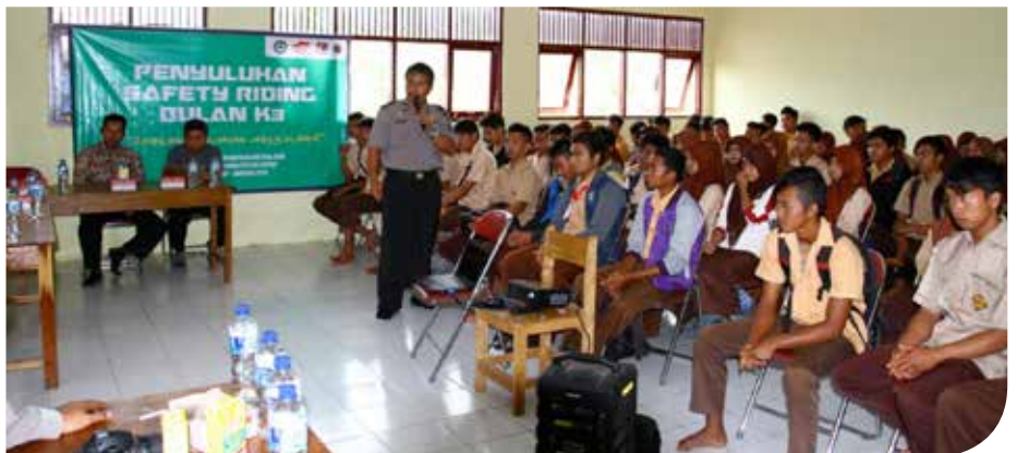
Suasana penyuluhan keamanan berkendara di SMK Kintap Tanah Laut