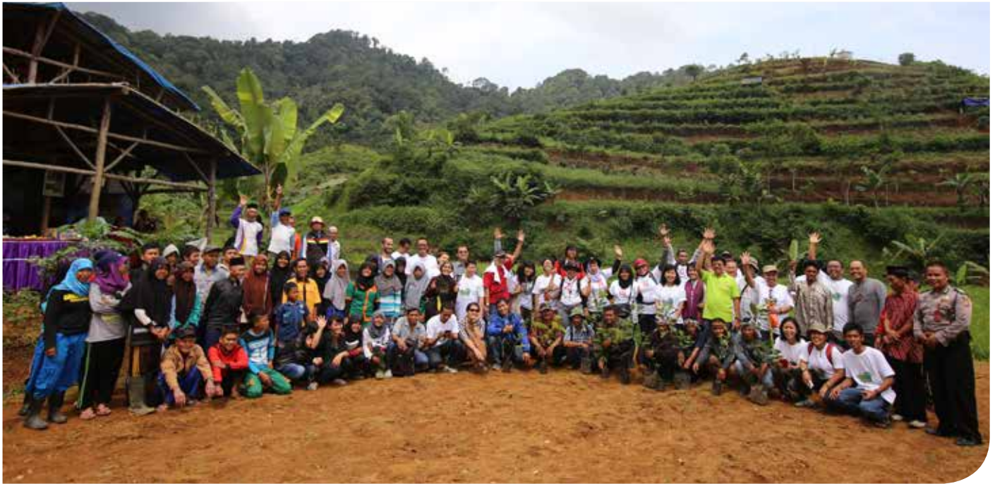
Grup Astra bersama seluruh pendukung "Ngaruwat Bumi" lainnya di wilayah Tunggilis

M asyarakat dunia memperingati Hari Bumi setiap tahun pada 22 April. Peringatan ini bertujuan meningkatkan kesadaran manusia agar lebih peduli dengan planet yang ditinggalinya.