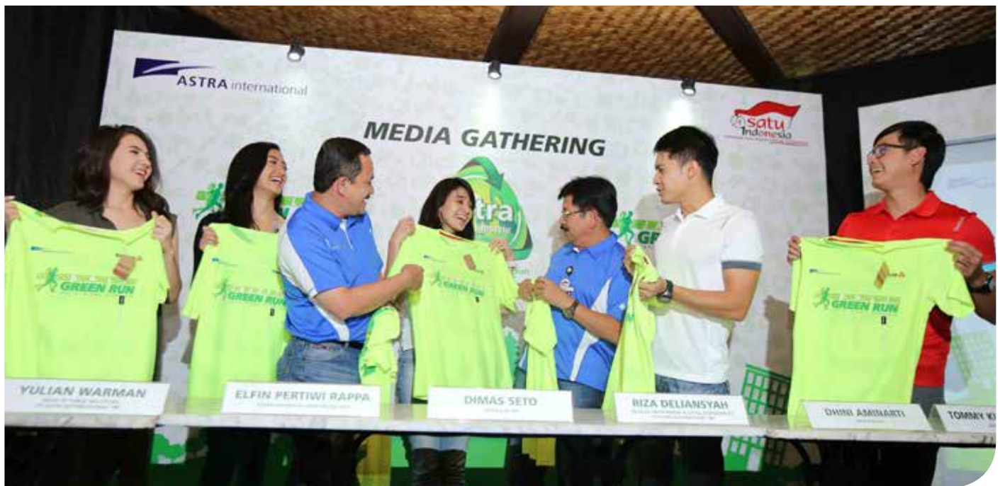
Foto bersama saat Kick Off program Astra Green Lifestyle

P T Astra International Tbk bersama anak perusahaan pada 14 April 2015 kembali mengadakan kick off program Astra Green Lifestyle (AGL).