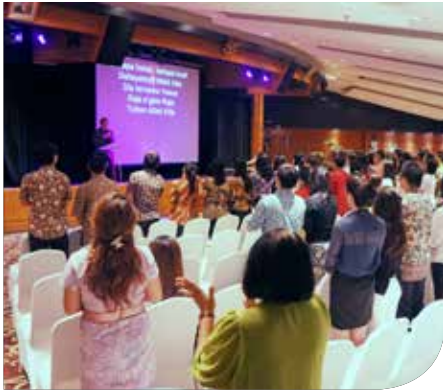
Foto kegiatan acara paskah Grup Astra