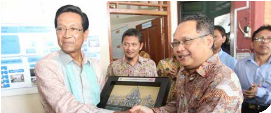
Ketua Pengurus YDBA, F.X. Sri Martono memberikan kenang-kenangan kepada Sri Sultan Hamengku Buwono X sesuai kunjungannya ke UMKM mitra YDBA, ED Alumunium

UMKM, termasuk kegiatan YDBA yang selalu mengikutsertakan ED Alumunium dalam pelatihan, assessment , kunjungan Grup Astra, benchmark ke Grup Astra serta pengembangan industri agar setara dengan second tier Astra. Sultan HB X pun memberikan bahwa arahan hendaknya ED Alumunium bisa mencapai standardisasi dengan bahan baku yang berkualitas sehingga dapat meningkatkan nilai jual produk.