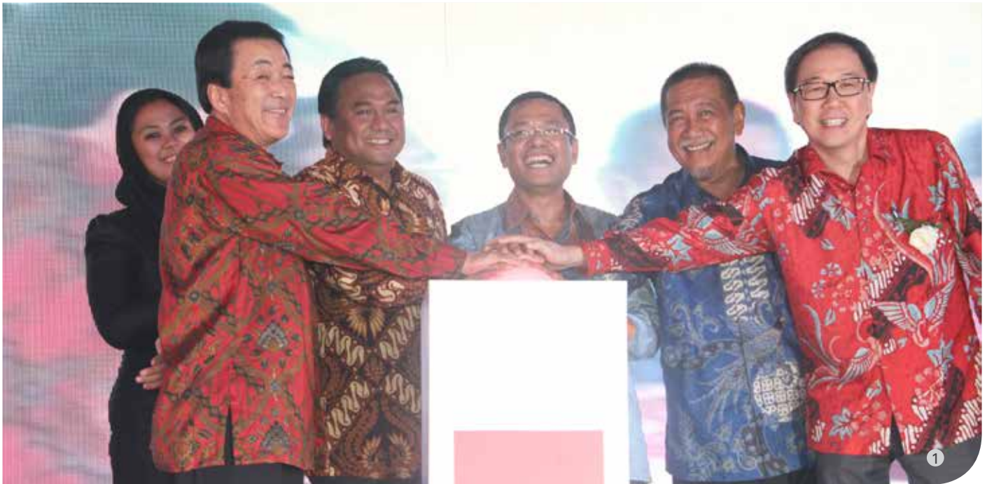
• Foto 1: Bersama memencet sirene peresmian pabrik baru Isuzu Astra Motor di Karawang