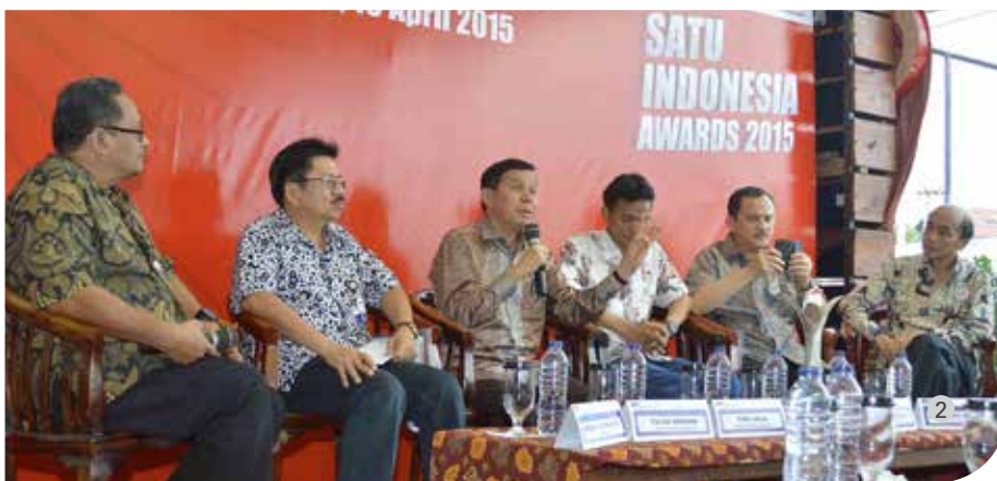
• Foto 1&2: Suasana Bincang Inspiratif di Bengkulu guna menjangkau sosok kemajuan bangsa

Setelah Jakarta, Bengkulu menjadi kota kedua yang dikunjungi tim penyelenggara Semangat Astra Terpadu Untuk (SATU) Indonesia Awards tahun 2015.