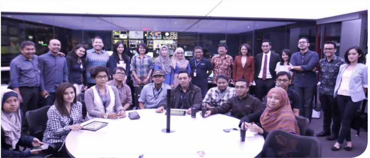
Bersama staf redaksi Net TV di newsroom

K etika program musik Dahsyat naik daun, beberapa stasiun televisi lain pun membuat program musik serupa. Namun, ada satu program musik yang berani tampil beda, Music Everywhere .