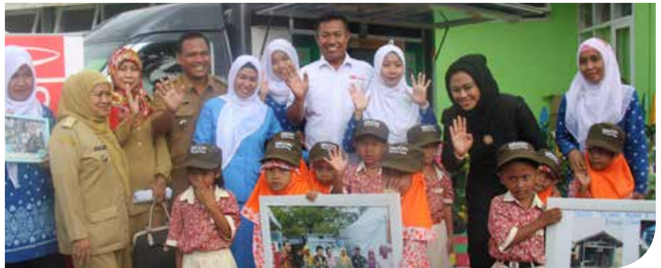
Pemberian bantuan paket buku bagi PAUD Anggrek dan PAUD Al-Falah

Kegiatan CSR ini meliputi pemberian bantuan paket buku bagi dua PAUD, yaitu PAUD Anggrek dan PAUD Al-