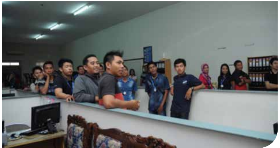
Karyawan FIFGROUP sedang menyimak penjelasan dalam sosialisasi peduli keselamatan berlalu lintas

Mengingat sebagian besar dari karyawan FIFGROUP adalah pengguna kendaraan roda dua dan menempuh jarak yang cukup jauh,