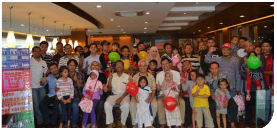
Manajemen AWP Divisi AWP berfoto bersama dalam acara makan siang bertepatan Terus Majukan AWP dengan QCC dan Core Value

baik dan berprestasi di perusahaan. Acara kemudian dilanjutkan dengan kesan dan pesan dari para juara konvensi selama bekerja di AWP serta permainan hiburan untuk anak-anak peserta yang hadir.