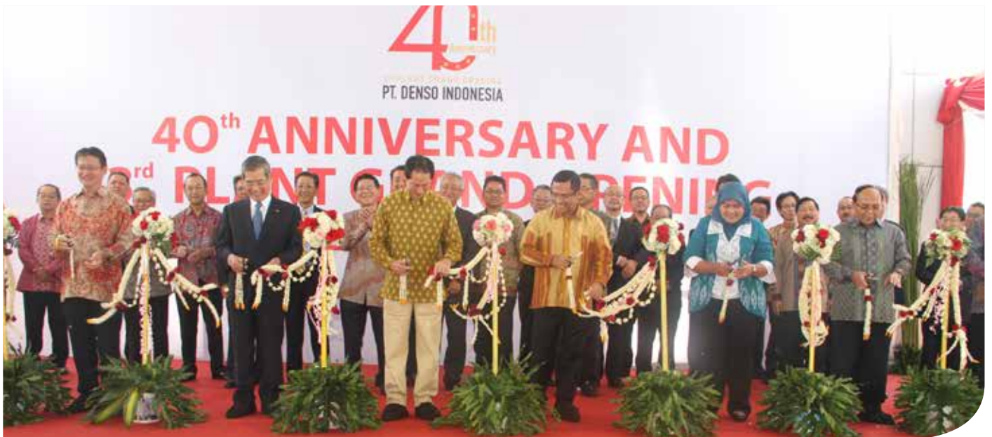
Pengguntingan pita di depan lobby utama pabrik ke-3

P T Denso Indonesia (DNIA) merayakan ulang tahun ke-40 yang jatuh pada 10 April 2015. Acara ini berlangsung meriah sebab, pada hari yang sama Denso meresmikan pabrik ketiganya.