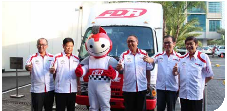
Jajaran manajemen PT Suryaraya Rubberindo Industries berpose bersama Gr1fty di depan FDR Service Car

“Kami berharap Gr1fty bisa menjadi juru bicara tidak hanya untuk mempromosikan produk FDR tapi juga untuk mengampanyekan