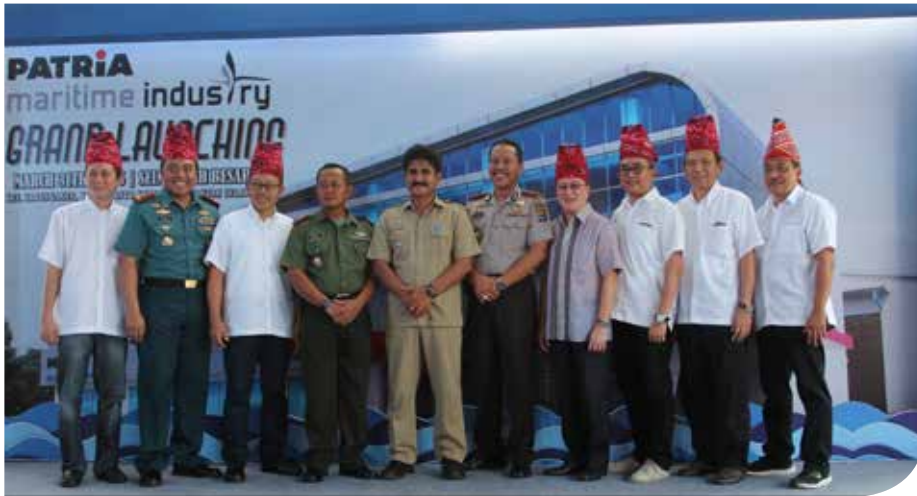
Foto bersama saat peluncuran galangan Patria Maritime Industry