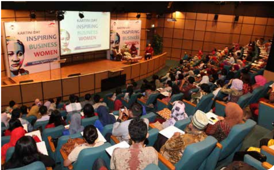
Suasana seminar "Inspiring Business Women" yang diadakan YDBA dalam rangka peringatan hari kartini, 21 April 2015

D alam rangka memperingati Hari Kartini, Yayasan Dharma Bhakti Astra (YDBA) mengadakan seminar dengan tema Inspiring Business Women . Menghadirkan tiga pengusaha wanita mandiri, seminar ini bertujuan memberikan informasi mengenai peluang sukses dan peranan wanita dalam dunia bisnis.