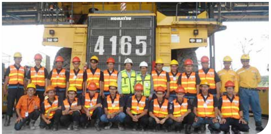
Murid SMKN 1 Palangkaraya berfoto bersama saat uji kompetensi

Kegiatan uji kompetensi siswa ini berlangsung pada 9-16 Maret 2015