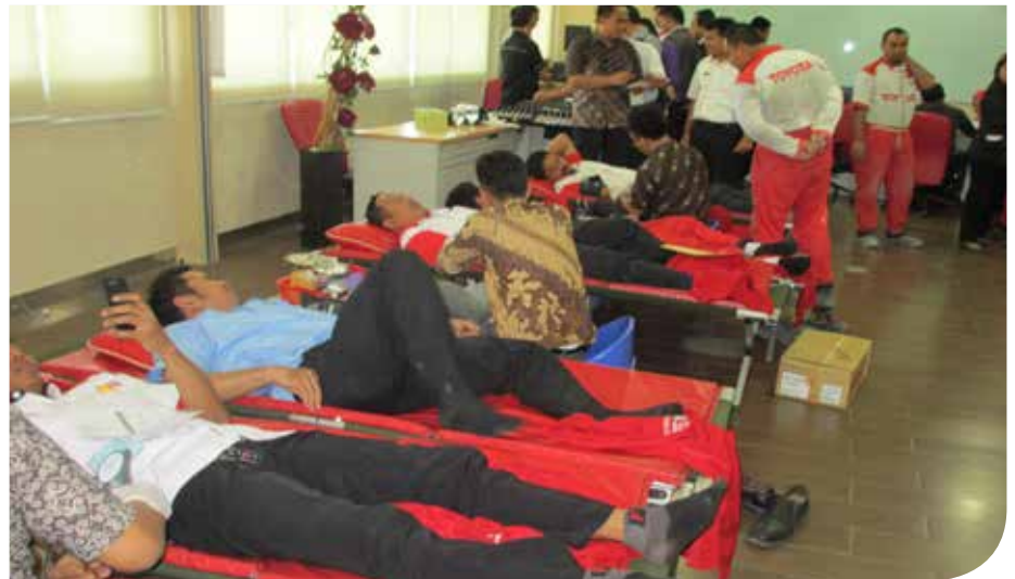
Suasana donor darah di AUTO2000 Ciledug

Bagi Auto2000 Ciledug, kegiatan donor darah merupakan program CSR yang secara rutin dilakukan setiap tiga bulan sekali. “Kegiatan